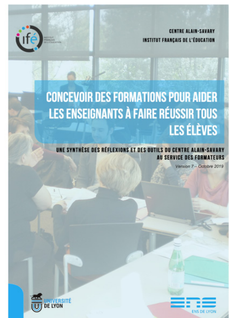
Centre Alain-Savary (2019), Concevoir des formations pour aider les enseignants à faire réussir tous les élèves